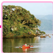
CATEMACO PUEBLO MÁGICO