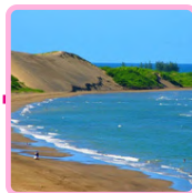
PLAYA DE CHACALAS