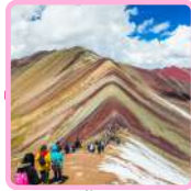
MONTAÑA DE SIETE COLORES