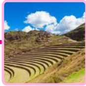
ZONA ARQUEOLÓGICA DE PISAC