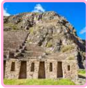
PARQUE ARQUEOLÓGICO NACIONAL OLLANTAYTAMBO