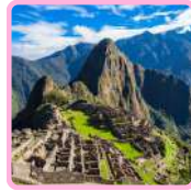
SANTUARIO HISTÓRICO DE MACHU PICCHU