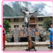
PUEBLO DE MACHU PICCHU