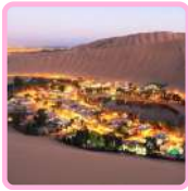
OASIS DE HUACACHINA