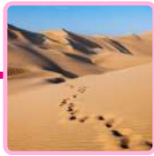
DESIERTO DE HUACACHINA