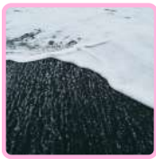
PLAYA DE ARENA NEGRA REYNISFJARA