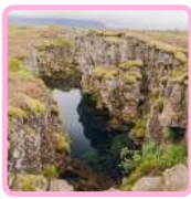
PARQUE NACIONAL THINGVELLIR