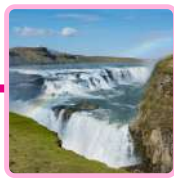
CASCADA DE GULLFOSS