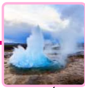
ZONA DE GÉISERES