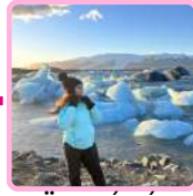
JÖKULSÁRLÓN GLACIER LAGOON