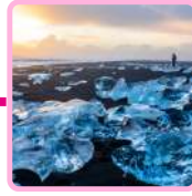
PLAYA DE LOS DIAMANTES