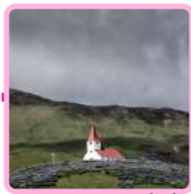
IGLESIA DE VÍK Í MÝRDAL