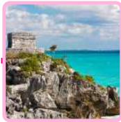
ZONA ARQUEOLÓGICA DE TULUM