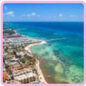
PLAYA DEL CARMEN