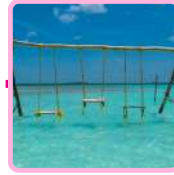
BACALAR PUEBLO MÁGICO