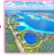
LAGUNA DE 7 COLORES