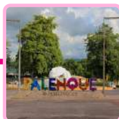
PUEBLO MÁGICO DE PALENQUE