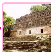
ZONA ARQUEOLÓGICA DE YAXCHILÁN