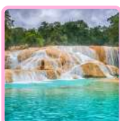
CASCADAS DE AGUA AZUL