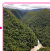
FRONTERA CON GUATEMALA