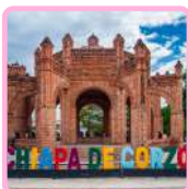
CHIAPA DE CORZO