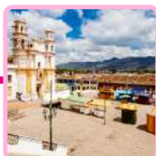
SAN CRISTÓBAL DE LAS CASAS