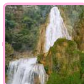
CASCADA EL CHIFLÓN