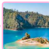
LAGOS DE MONTEBELLO