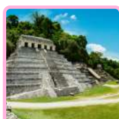
ZONA ARQUEOLÓGICA PALENQUE