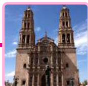
CATEDRAL DE CHIHUAHUA