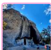
CUEVA DE DOÑA PETRA