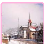
PUEBLO MÁGICO DE CREEL