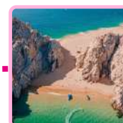
PLAYA DEL DIVORCIO