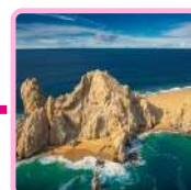
PLAYA DEL AMOR