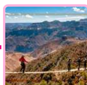
PARQUE AVENTURAS (PODRÁS HACER TIROLESA, ZIP RIDER, SUBIR AL TELEFÉRICO)